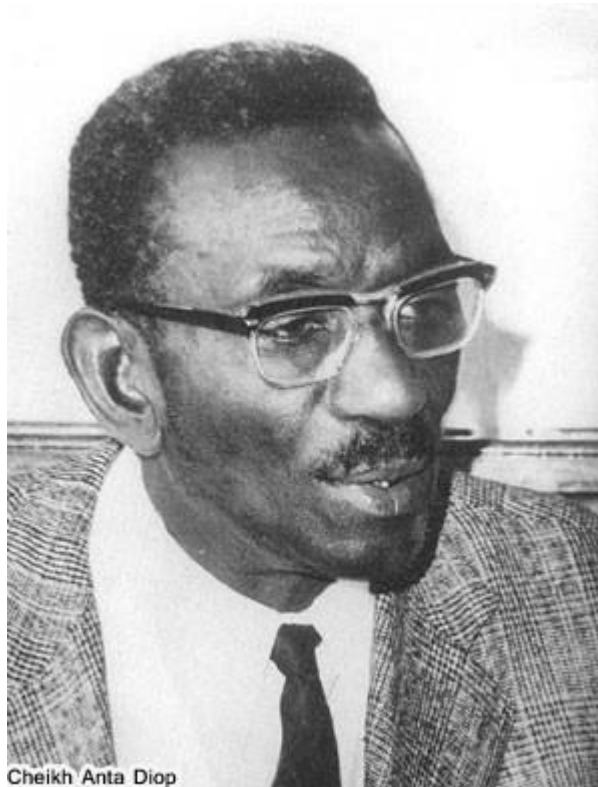
Cheikh Anta Diop

Né en 1923 dans un petit village du Sénégal, Caytou. L'Afrique est sous la domination coloniale européenne qui a pris le relai de la traite négrière atlantique commencée au 16ème siècle. La violence dont l'Afrique est l'objet, n'est pas de nature exclusivement militaire, politique et économique. Théoriciens (Voltaire, Hume, Hegel, Gobineau, Lévy Bruhl, etc.) et institutions d'Europe (l'institut d'ethnologie de France créé en 1925 par L. Lévy Bruhl, par exemple), s'appliquent à légitimer au plan moral et philosophique l'infériorité intellectuelle décrétée du Nègre. La vision d'une Afrique anhistorique et atemporelle, dont les habitants, les Nègres, n'ont jamais été responsables, par définition, d'un seul fait de civilisation, s'impose désormais dans les écrits et s'ancre dans les consciences. L'Égypte est ainsi arbitrairement rattachée à l'Orient et au monde méditerranéen géographiquement, anthropologiquement, culturellement.